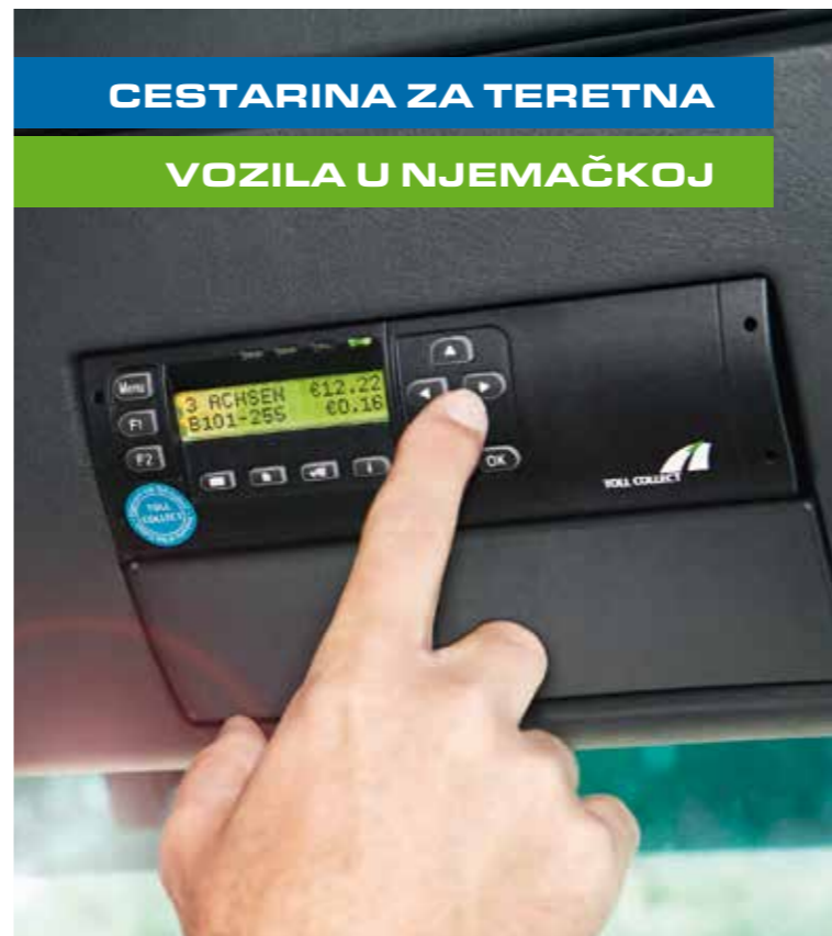
Toll Collect GmbH, KOM, Berlin, oos, V 4,1, HR - Stanje 10/2014

* besplatno, cijene mobilnih operatera mogu odstupati ** unutar Njemačke: fiksna cijena 3,9 ct/min; cijene mobilnih operatera maksimalno 42ct/min