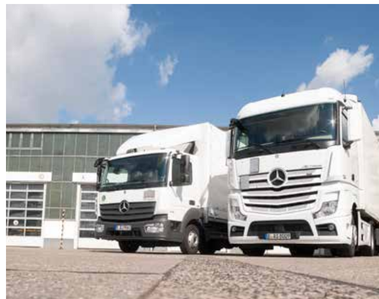
Toll Collect GmbH, KOM, Berlin, 094, V 3.0, HR – Stanje 2/2015

* besplatno, cijene mobilnih operatera mogu odstupati ** unutar Njemačke: fiksna cijena 3,9 ct/min; cijene mobilnih operatera maksimalno 42ct/min