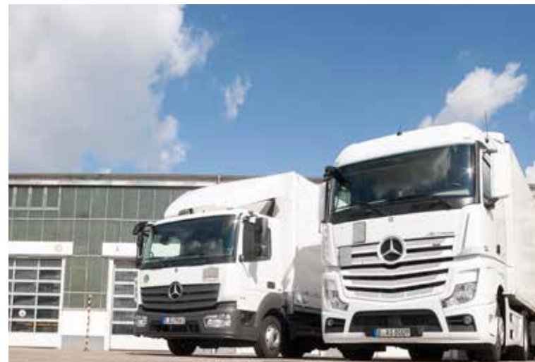
Toll Collect GmbH, KOM, Berlin, 094, V 3.0, SK – Stav 2/2015

* zadarmo, hovory z mobilných sietí sa odlišujú ** v Nemecku: Cena z pevnej linky 3,9 ct/min; ceny z mobilných sietí max. 42 ct/min