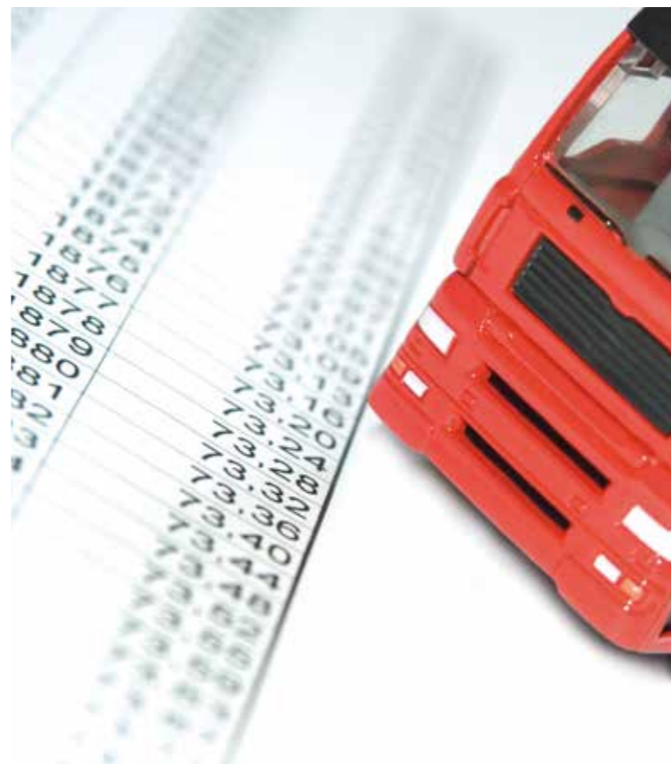
Toll Collect GmbH, KOM, Berlin, 095, V 4, 0, DK – Status: 07/2015