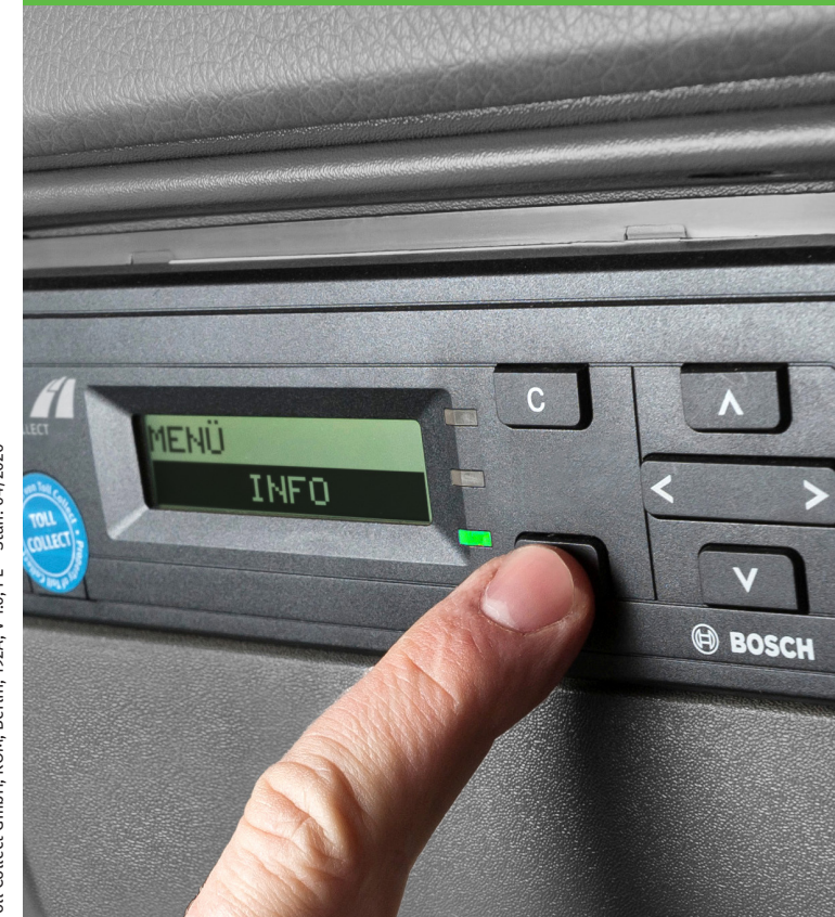
Toll Collect GmbH, KOM, Berlin, 192A, V 1.0, PL – Stan: 04/2020