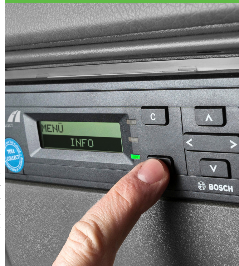
Toll Collect GmbH, KOM, Berlin, 192A, V 1.0, SK – Stav 04/2020